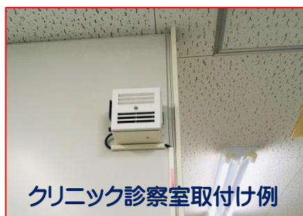
クリニック診察室取付け例