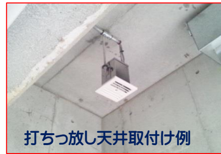
打ちっ放し天井取付け例