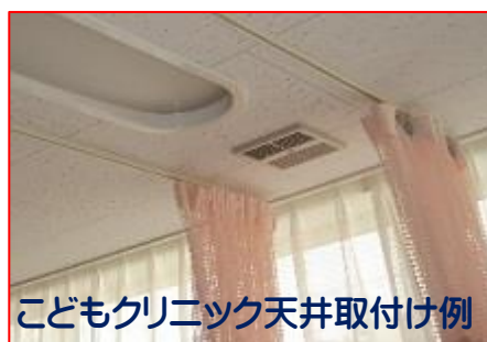
こどもクリニック天井取付け例